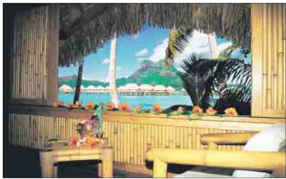
Eine Insel mit zwei Bergen: Vom Strand-Bungalow des Pearl Beach sieht Bora Bora wie ein Märchen aus.

verschiedene Wellness- und Sportprogramme für Familien in heimischer Atmosphäre an. Kinder erhalten oft kostenlosen Skiunterricht oder übernachten gratis. Zudem lädt die Höhenlage nördlich und südlich von Ötztaler, Stubai und Zillertaler Alpen zu Sportarten wie Nordic Walking oder Langlaufen ein. Weitere Infos unter www.mittlerherzblut.com Ideal für einen günstigen und erholsamen Kurzurlaub