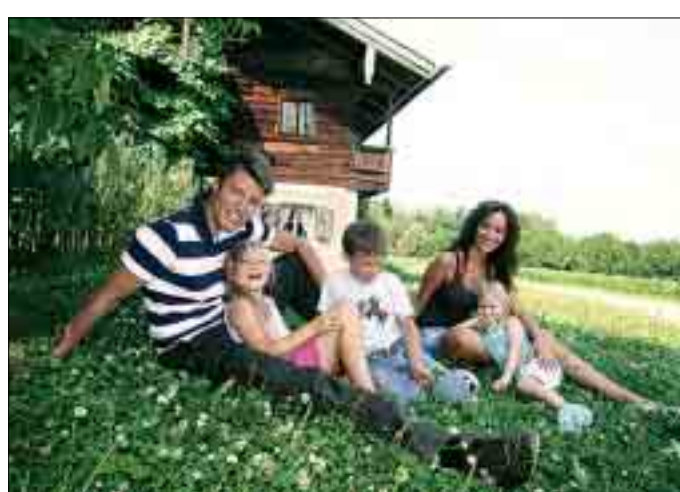
Nicht nur Familien finden in der Ferienregion Rottal Inn ihr Urlaubsparadies. Die Region lässt sich besonders gut mit Pauschalangeboten entdecken.

Weitere Informationen gibt es auch im Internet unter der Adresse: www.urlaubs4.de