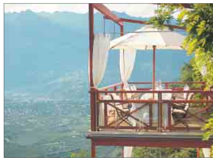
Genießen Sie gastronomische Höhenflüge - und eine fantastische Aussicht.

Weitere Infos: Relais & Chateaux Hotel Castel Fragsburg Fragsburgerstraße 3 I-39012 Meran, Südtirol info@fragsburg.co www.hotelfragsburg.com