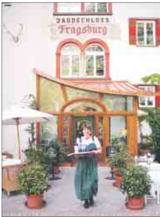
Das Restaurant bekam von Gault Millau zwei Hauben.

Hoch über dem Meraner Land schwebt das kleinste Luxushotel der Dolomiten. Willkommen im Relais & Chateaux Hotel Castel Fragsburg! Eingebettet in eine bezaubernde Landschaft präsentiert sich das einstige Jagdschloss im edlen, modernen Landhausstil. Zudem überzeugt die ruhige Lage mit Panoramablick auf das gesamte Meraner Tal und die Südtiroler Alpen.