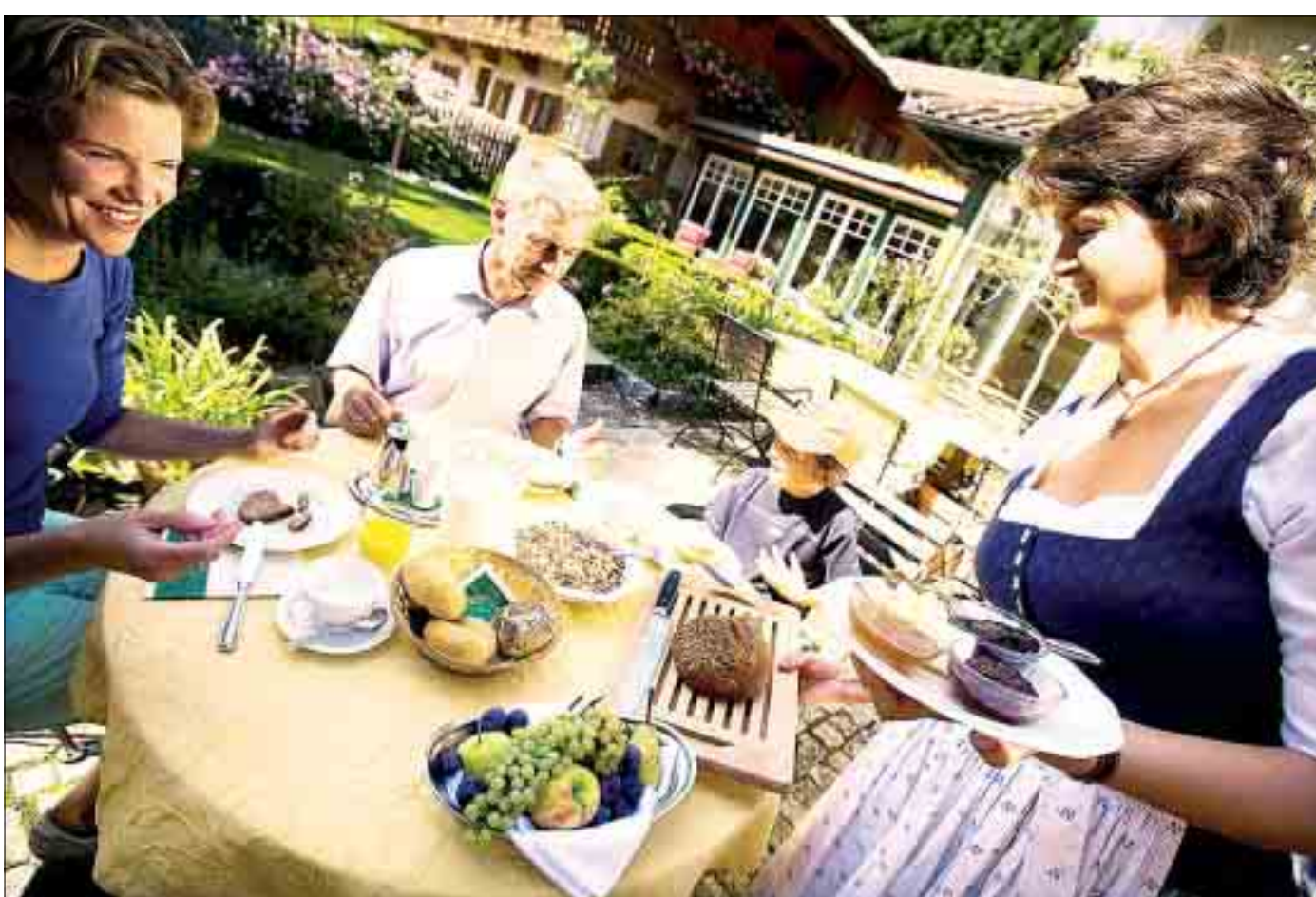
Genauere Informationen über die 450 Alpinen Gastgeber findet man im Katalog oder im Internet unter der Adresse www.alpine-gastgeber.com

Das Portal für Freizeit, Ferien & Feste präsentiert Ihnen die schönsten Urlaubstipps aus Bayern