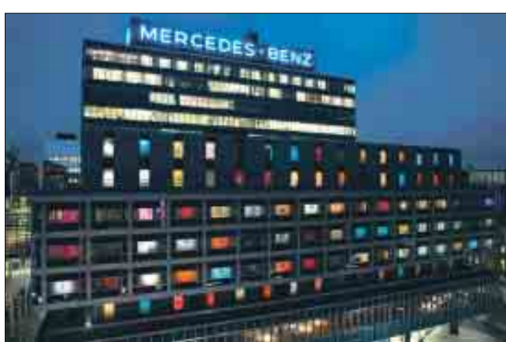
Lichtspielhaus der Extraklasse: das Nordic Light Hotel in Stockholm.

und Abendessen einlädt. Er ist gleichzeitig Location für Events und Club-Abende, auch für auswärtige Gäste. Der Raum ist bewusst ganz in Weiß gehalten, um eine klare Harmonie und grenzenlose, sphärische Weite zu vermitteln.