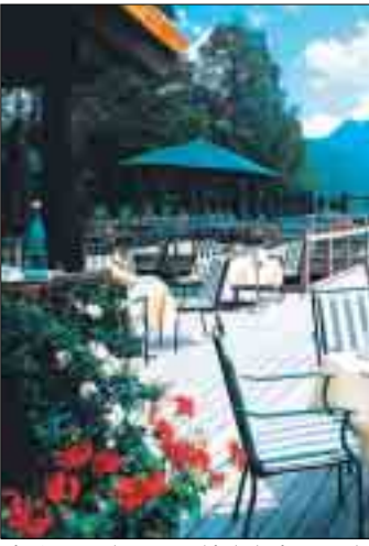
Die Sonnenterrasse bietet einen entspannenden Blick über den Fuschelsee.

Doch Schloss Fuschl ist weit mehr als eine Pilgerstätte für Sissi-Fans: Seit Juli 2006 glänzt das Anwesen mit 65 Doppelzimmern, 39 Suiten und sechs Ferienhäusern als Luxusherberge der Sonderklasse. Zuvor hatte die Betreibergruppe Arabella Starwood Hotel & Resorts, die das Schloss seit 2001 managt, das architektonische Kleinod mit dem 550 Jahre alten Schlossturm in nur acht Monaten aufwendig renoviert. Das Ergeb-