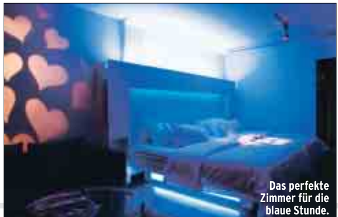
Das perfekte Zimmer für die blaue Stunde.

Der Gast wird Meister des Lichts nen Befindlichkeit anpassen: Ein Klick, und der Raum ist in beruhigendes Blau getaucht – ideal zum Einschlafen. Wer Anregung sucht, wählt, klick!, betörendes Rot; und wenn man sich in der kalten Jahres-