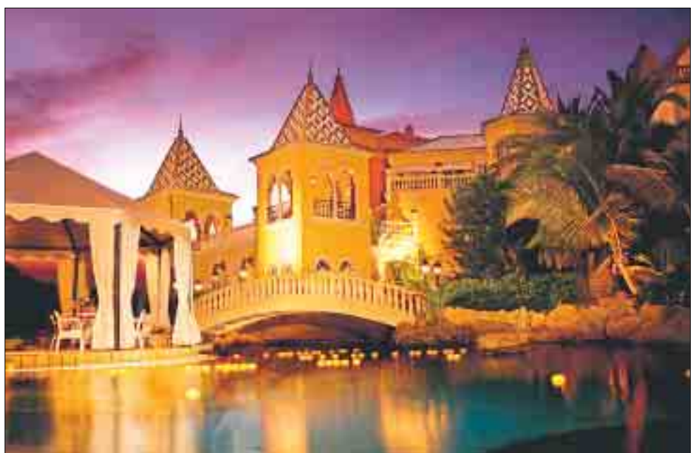
Die Meeresbrise und das weiche Licht des Südens verwandeln das Resort in einen Traumalast.