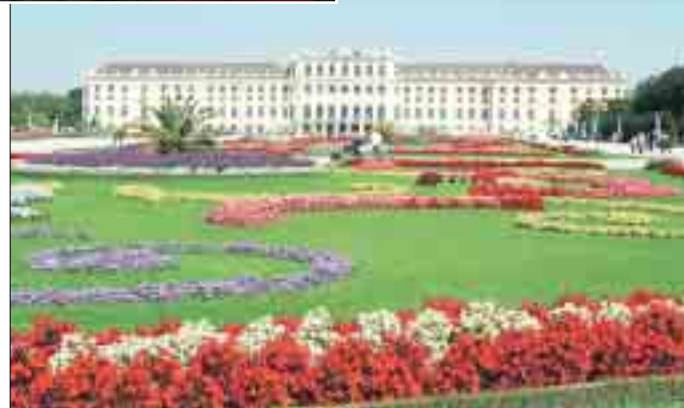
Beliebtes Kurzreiseziel: Wien und sein Schloss Schönbrunn.