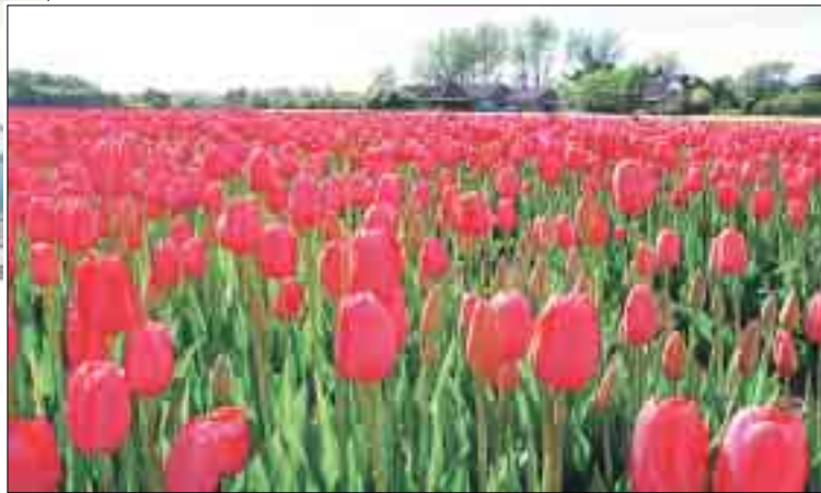
Nur ein paar Busstunden weg: Tulpenfeld auf dem Keukenhof bei Lisse.