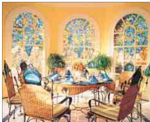
Prächtige Mosaikfenster in einem der neun Hotel-Restaurants.