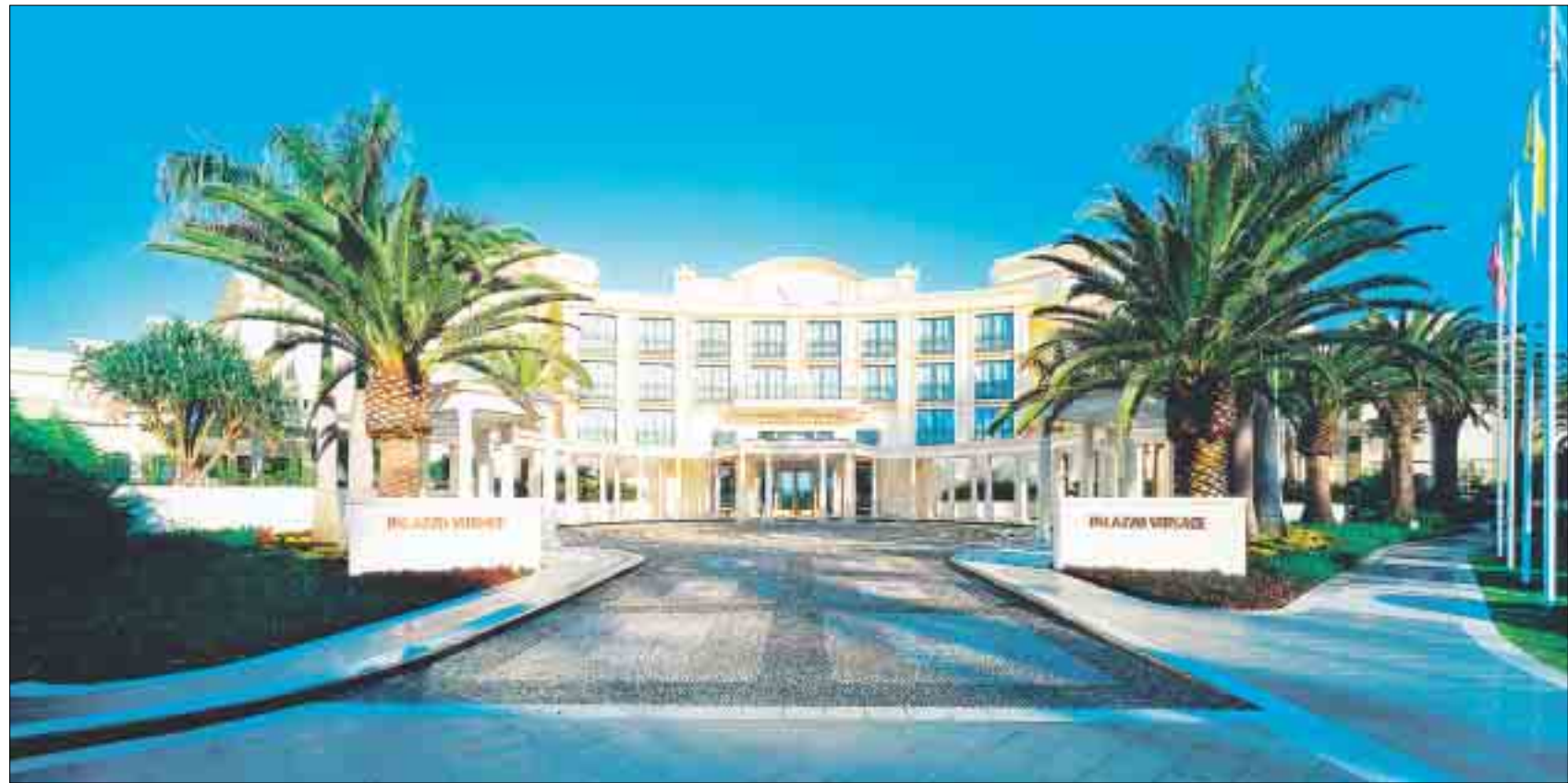
Willkommen im Versace-Traumland! Die gut betuchte Klientel fährt ihre Limousinen in der Auffahrt des Hotels über das zweitgrößte Pflastermosaik der Welt.

kommt, taucht ganz in die Lebenswelt des Versace-Clans ein. Ob Zahnputzbecher, Geschirr oder Stoffe für Sofas und Stühle – jedes Teil stammt aus der eigenen Ver-