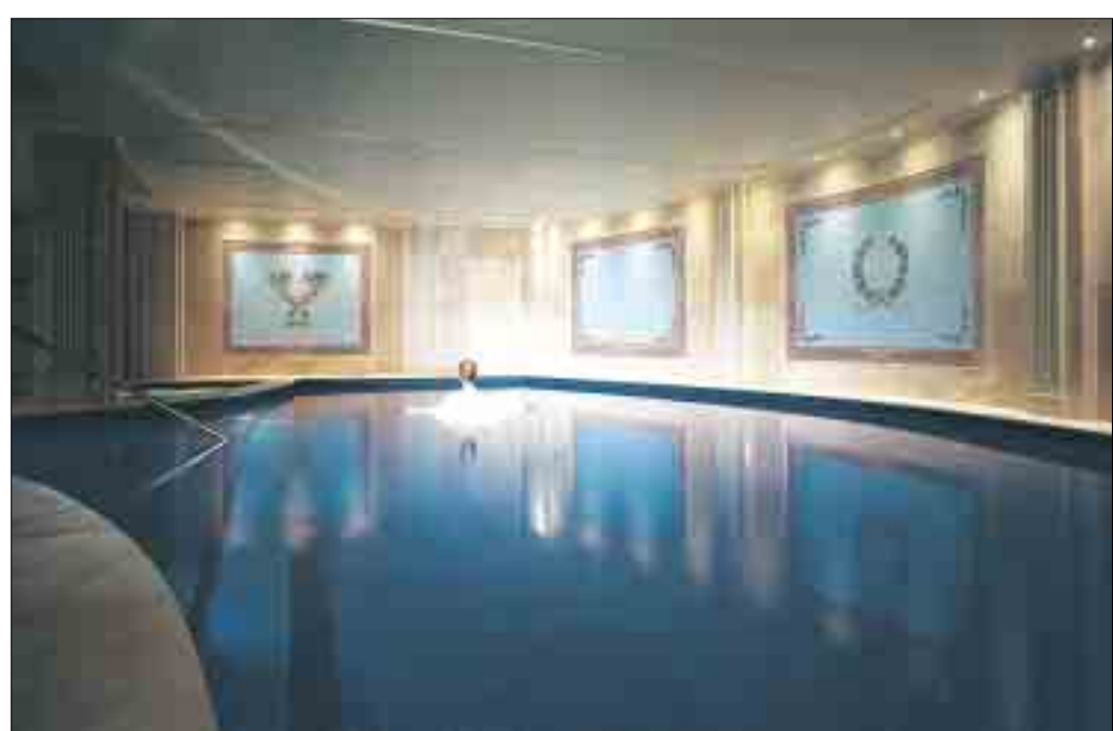
Im vollkommen ruhigen Wellnessbereich des Palazzo schwimmen die Gäste im Luxus.

lands. Und selbstredend wurde der Marmor für die Böden aus Carrara herbeigeschafft. Die Auffahrt zum Palazzo Versace ist das zweitgrößte Pflastermosaik der Welt. Und natürlich fahren hier die teuersten und seltensten Automobile vor, die sich mit Geld kaufen lassen. Ebenso außergewöhnlich reich ist schließlich die Klientel. Wer 20 000 Euro für die Übernachtung zahlt und drei Wochen bleibt, begleicht die Champagner-Rechnung über 30 000 Euro mit Peanuts. Hier lässt es sich die mondäne Gesellschaft eben gut gehen. Richtig gut. Mein Tipp: Ich lasse mich verwöhnen im Salus per